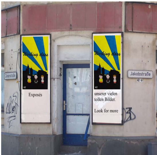
Straßengalerie – Kunst im öffentlichen Raum

Unsere Idee: Macht eine Straßengalerie draus.