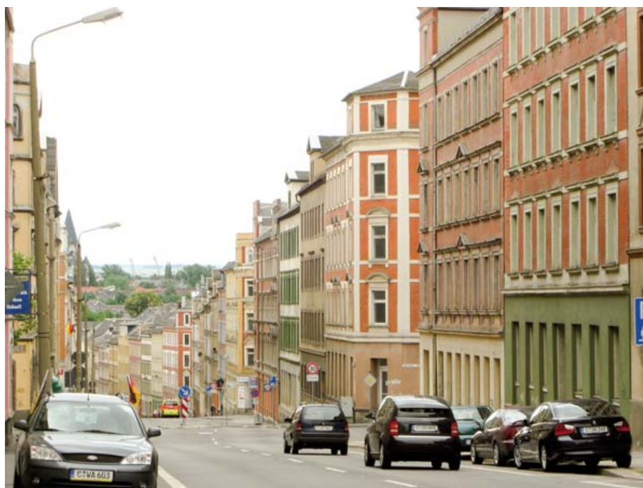
Foto: Blick in die Zietenstraße

Der Verein StadtHalten Chemnitz e. V. will für die Eigentümer ein Angebot zur Sicherung der Quartiere schaffen. Insbesondere sollen durch niedrighschwellige Angebote der Gebäudesicherung und durch Anleitung von „Hauskümmerern“ zunächst „Konservierungsmaßnahmen“ im Quartier durchgeführt werden, um Zeit für gemeinsame Lösungen mit den Eigentümern zu gewinnen.