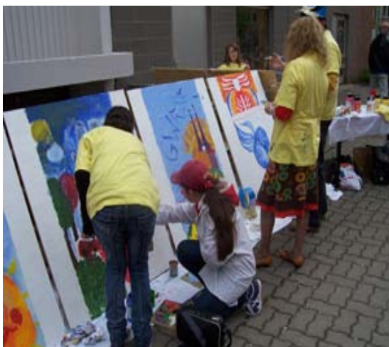
Kinder und Jugendliche bemalen Bildtafeln

Die Idee besteht darin, Kinder, Jugendliche und Künstler im Rahmen von Workshops in Schulen oder bei Veranstaltungen, auf vorformatierte und grundrierte Holzwerkstoffplatten Bilder malen zu lassen und diese an den Fensteröffnungen leer stehender Häuser an der Zietenstraße und den angrenzenden Straßen zu befestigen. Diese gestalteten Flächen im öffentlichen Raum sollen Ausdruck dafür geben, welches Potential an Kreativität und Einfallsreichtum in diesem Stadtteil steckt. Durch die Beteiligung der Kinder und Jugendlichen sollen über die Eltern möglichst viele BewohnerInnen in das Konzept einbezogen werden und somit die Selbstwahrnehmung und Wertschätzung für den öffentlichen Raum im Stadtteil erhöht werden. Bisher wurden bereits über 60 Tafeln zur Bepflanzung von Fenstern bemalt! Aber es soll weiter gehen.