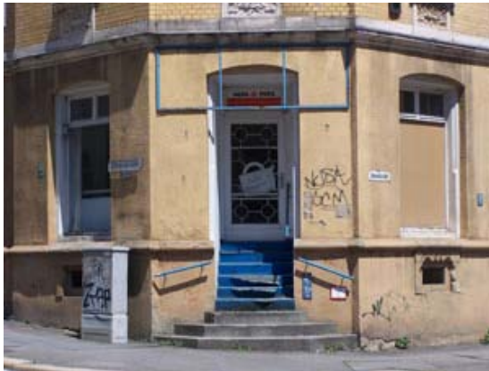
Leeres Haus, Zietenstraße